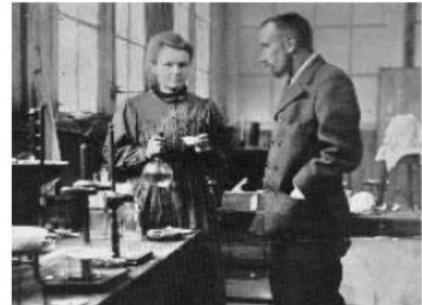
Marie SKLODOWSKA CURIE Pierre CURIE

1898 Radioactivité Le polonium et le radium