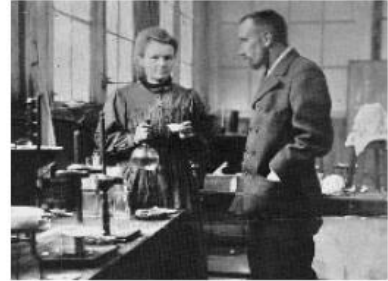
Marie SKLODOWSKA CURIE Pierre CURIE

1898 Radioactivité Le polonium et le radium